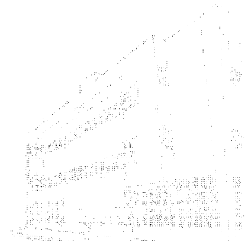
Edifício Marechal Rondon - Sede atual 2013